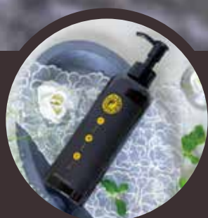
超開運シャンプー「天地人」